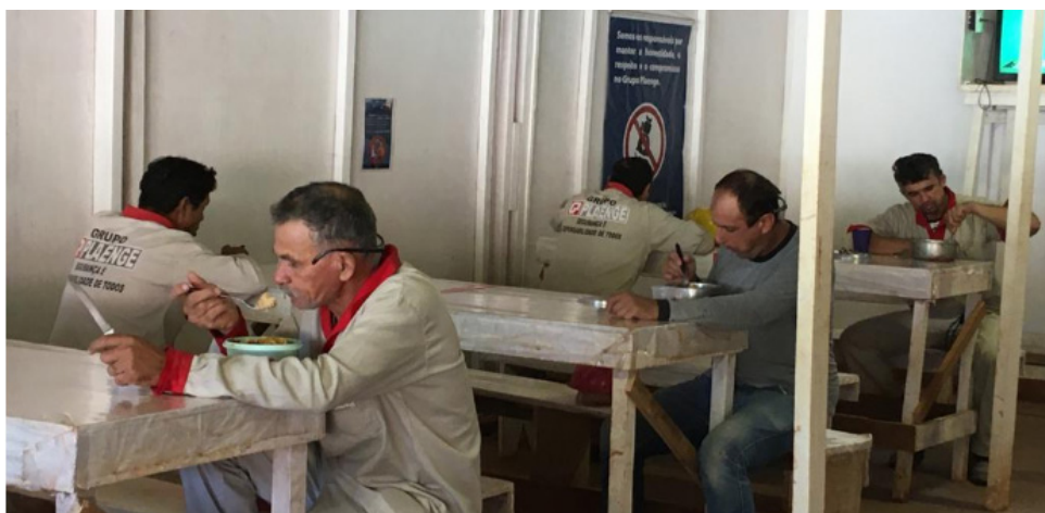
Distanciamento social nos refeitórios.

Os colaboradores receberam orientações sobre os cuidados em casa, ao embarcarem no transporte público, bem como sobre as novas formas de relação dentro do canteiro de obras. Apenas os colaboradores que não se enquadram no grupo de risco retornaram às obras, com garantia de todas as medidas de higienização, prevenção e não aglomeração no ambiente de trabalho.