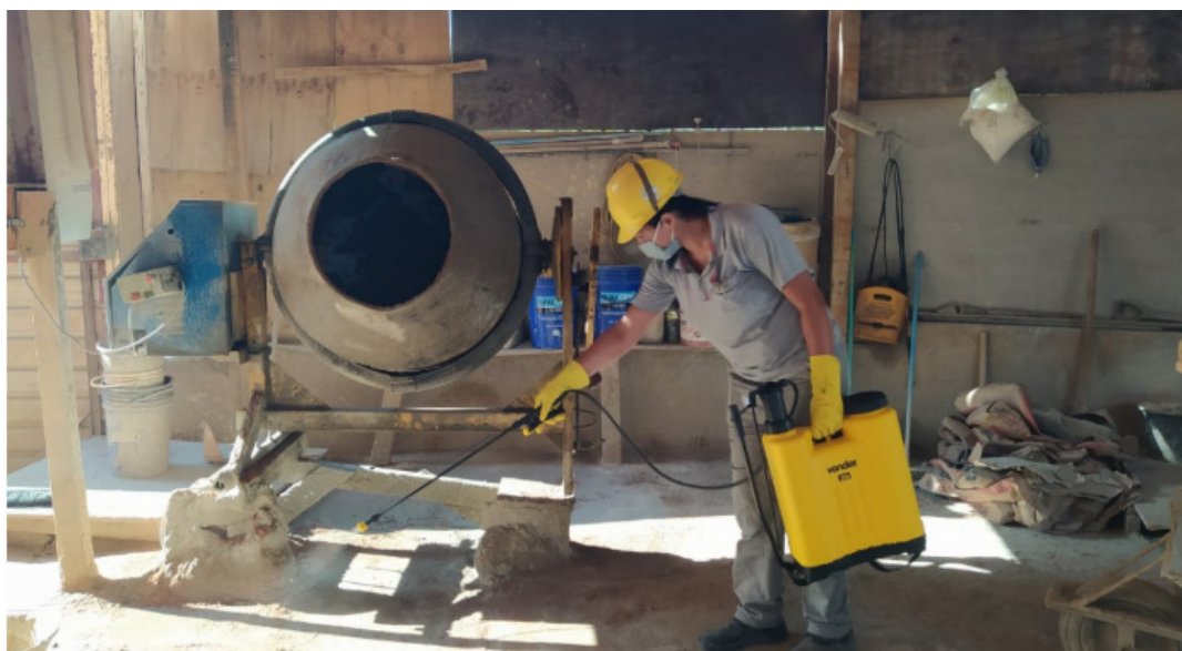
Desinfecção e sanitização de ambientes e peças nas obras da Plaenge.

Entre as principais medidas estão aferimento de temperatura corporal ao entrar no local de trabalho; aumento no fornecimento de lavatórios com água e sabão, além de sanitizantes, como álcool 70%, pontos de higienização e orientação sobre o uso, no início dos trabalhos e pelo menos a cada duas horas; ventilação adequada nos ambientes de trabalho e distanciamento social em ambientes fechados do canteiro de obras, como escritórios e refeitórios. Já os funcionários que se enquadram no grupo de risco, como idosos, diabéticos, hipertensos, pessoas que tem insuficiência renal crônica, doença respiratória crônica ou doença cardiovascular, foram dispensados para estar junto de suas famílias neste momento delicado, com todos seus direitos assegurados.