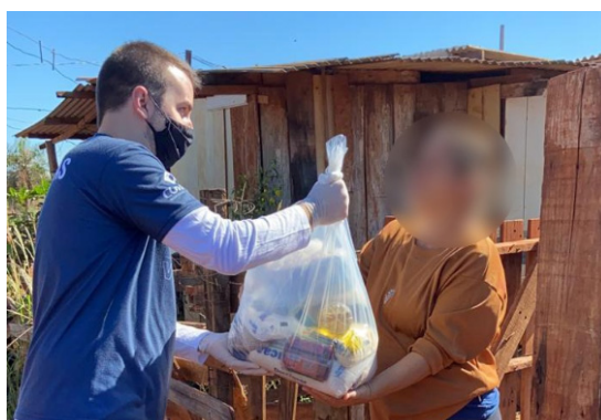
Entrega de mantimentos em comunidades carentes de Dourados.

A campanha está diretamente ligada às consequências dos últimos acontecimentos. Devido à pandemia, muitas pessoas enfrentam uma situação financeira de calamidade. Atualmente, boa parte da população de classe baixa trabalha com diárias e tem sofrido arduamente com os direcionamentos de quarentena no município.