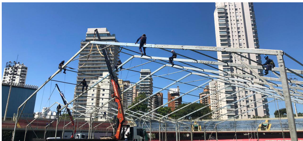
Construção do Hospital de Campanha no Complexo Ginásio do Ibirapuera, na Zona Sul da capital paulista

Estimada em R$ 12 milhões e com custeio mensal de manutenção da operação, R$ 10 milhões, a construção do hospital envolverá cerca de 800 profissionais, sendo por volta de 500 da área de enfermagem, contratados pelo Seconci-SP. Não há data prevista para o encerramento das atividades.