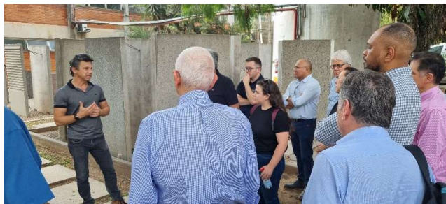
FACHADAS PRÉ-FABRICADAS - STAMP