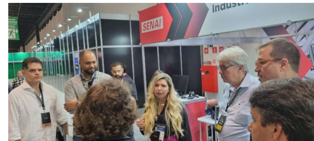
FEIRA MODERN CONSTRUCTION SHOW