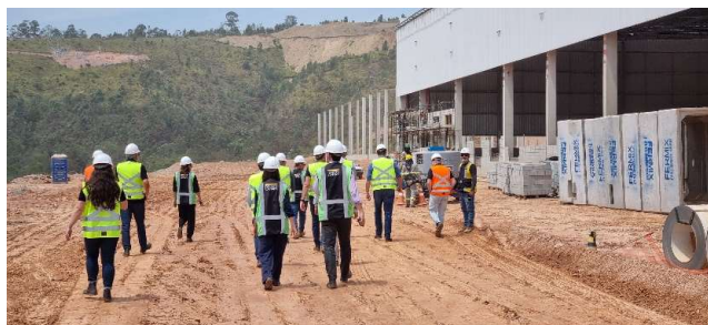
CENTRO LOGÍSTICO GOLGI - CAJAMAR